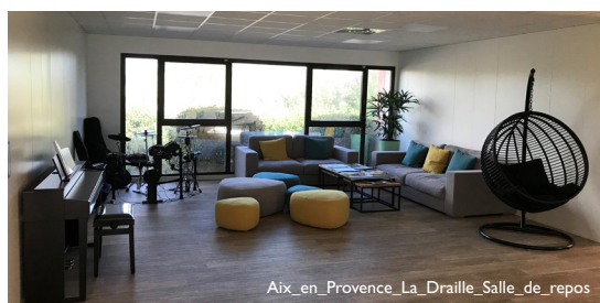
Aix-en-Provence, La Draille, Salle de repos

Le deuxième semestre 2021 a permis à la SCPI Atlantique Mur Régions de poursuivre sur sa lancée. Elle a reçu 22 nouveaux locataires représentant 26 540 m² et a signé 6 baux, représentant 8 370 m², qui prendront effet début 2022.